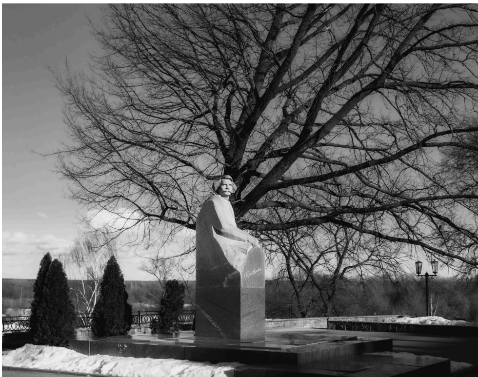
Сергеев-Ценский в камне