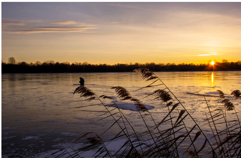
Солнце над камышами