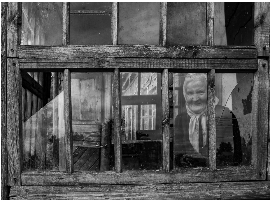
По ту сторону окна