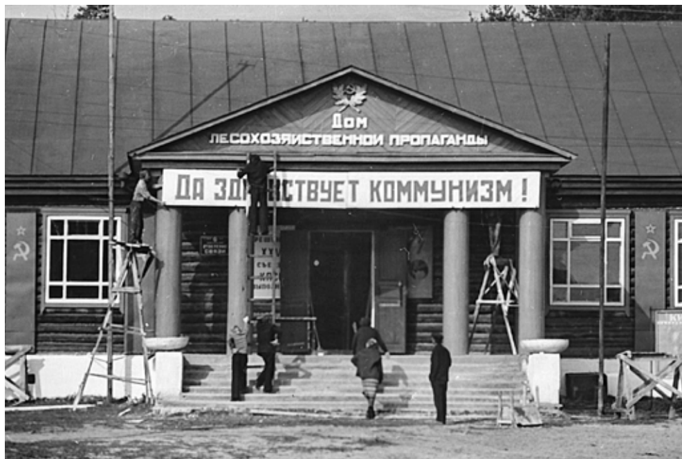
Да здравствует коммунизм!