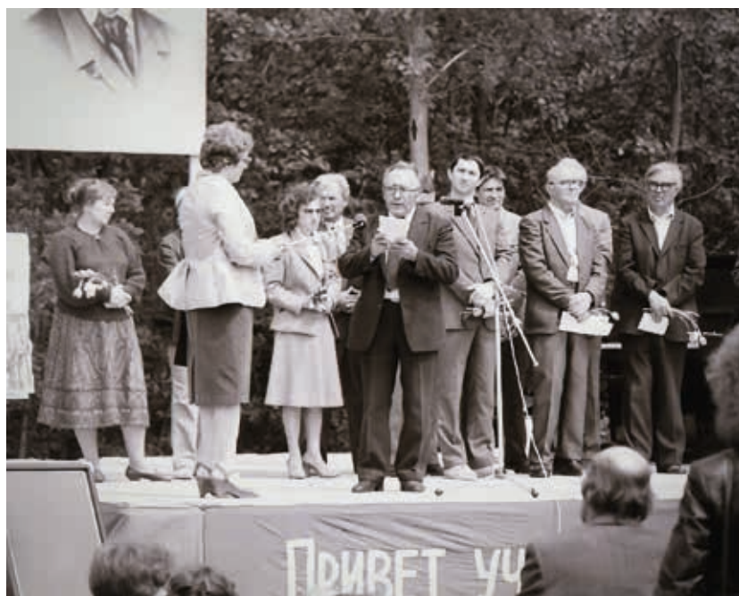
Литераторы на сцене