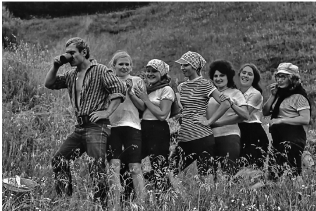
Стройотряд. За водой