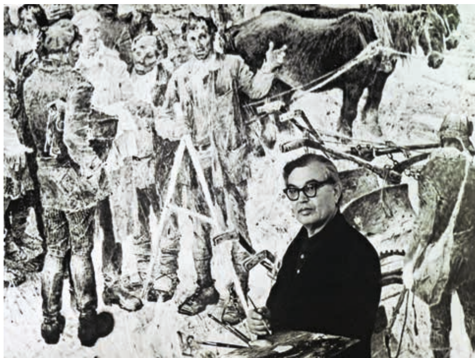
Художник у картины