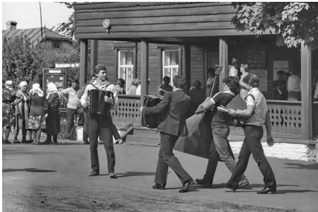
Музыканты в селе